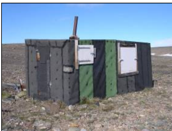
T.v.: Germania Land hytten [702] (Gl. Syltekrukke)

pakis, og isen lå stadig fast i Dove Bugt helt fra Stormnæs. Dog fik vi øje på Dagmar Havn hytten [620] på 3-4 km afstand, men måtte vende om og returnere til Danmarkshavn, da isen langsomt lukkede sig om os.