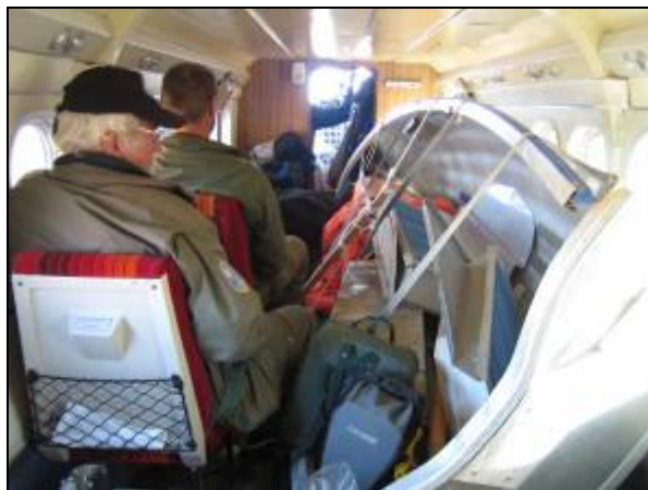
Med alujollen som blind passager!

Næste morgen fløj vi mod Danmarkshavn i det skønneste vejr. Vi var de eneste passagerer, og med ubegrænset sigt over terrænet fik vi hurtigt et indtryk af, hvad der ventede os. På den en time lange flyvetur var