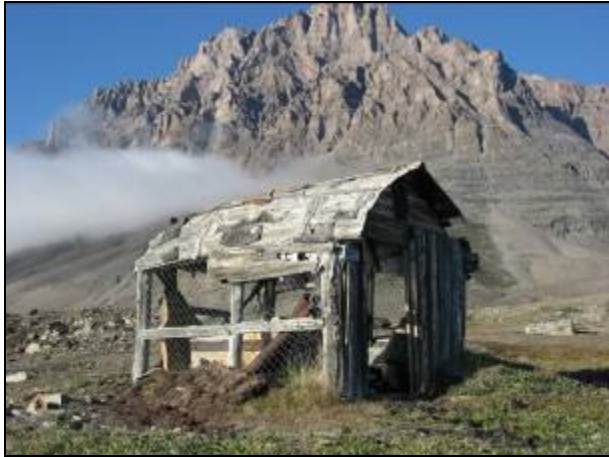
Den ældste af Kongeborg hytterne [224-1].

Vi ankom til Mestersvig sidst på aftenen. Den sidste del af turen sejlede vi i tæt tåge vha. GPS. Tågen lettede heldigvis, da vi nærmede os land.