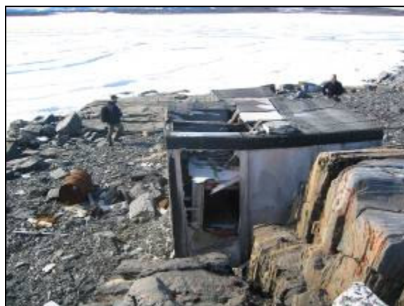
Bamserne er glade for Heeringhus [626]

dage nåede vi frem til Fyrretyvekilomternæsset. Her efterlod vi alujollen, tog rygsækken på og vandrede videre mod nord. Næste dag nåede vi både Micardbu [704] og Thomas Thomsens Næs hytten [707]. Trods tæt tåge gik vi det meste af vejen på isen, da der på landet nærmest var ufremkommeligt af mudder og snefaner. Begge hytter er meget medtagne og Micardbu, som for 3-4 år siden var i rimelig stand, nærmer sig også ruintilstand.