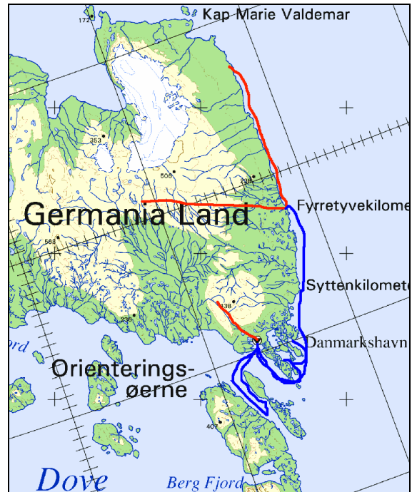
Nordholdets rejserute i 2006. I løbet af sommeren blev der sejlet ca. 200 km (blå) med motorbåd og vandret ca. 170 km (rød).