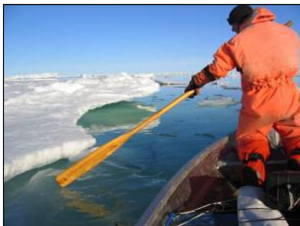
... og fra vandhøjde.