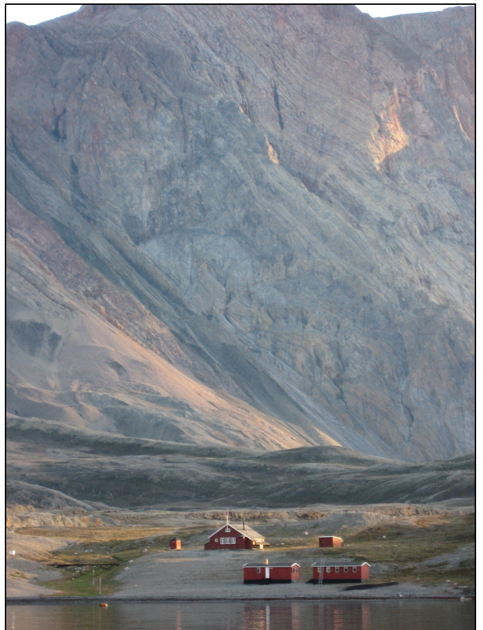
Ankomst til Ella Ø. Ørnereden med Bastionen i baggrunden.