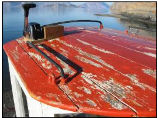
"Agsut"s styrehus før renovering.

Vi sejlede tilbage gennem Sofia Sund. Planen var at overnatte i en lille vig i munden af Vega Sund, men grundet kraftig blæst og store bølger ud for munden af sundet, satte vi kursen mod