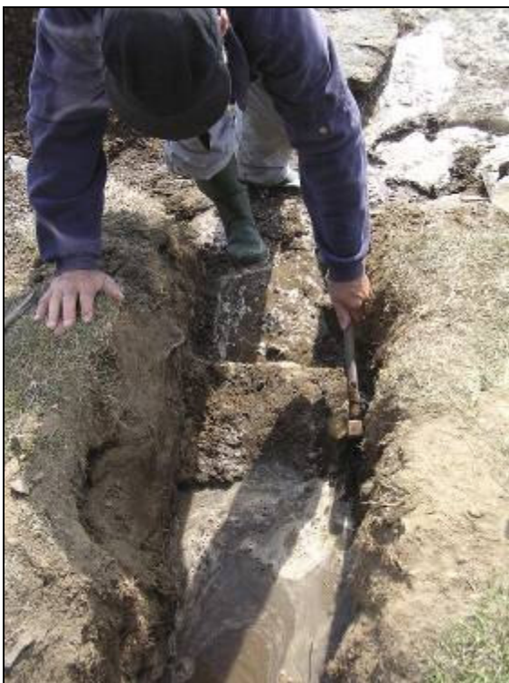
Vandet fra huset ledes ud gennem dræningskanalen.

Huset fremstår i dag ganske som det så ud efter ombygningen ifølge fotos og tegninger fra 1919. Det er imidlertid bygget på en skrånende klippegrund, hvilket har medført at store mængder ral og grus har samlet sig op ad nordvæggen. Det medfører store vandmængder inde i huset om foråret og sommeren. Vi har lavet en midlertidig dræning ud gennem sydvæggen.