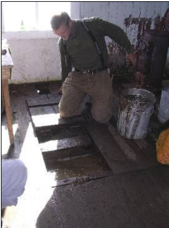
Gulvet åbnes. Der står blankt vand helt op til gulvbrædderne.

Efter to strenge år, hvor bl.a. to fangstmænd døde af skørbug pga. udeblevne forsyninger, måtte huset forlades. I resten af fangstmandsperioden blev det kun sporadisk benyttet. Igennem årene har vejrstationens personel omhyggeligt vedligeholdt det med tagpapdækning.