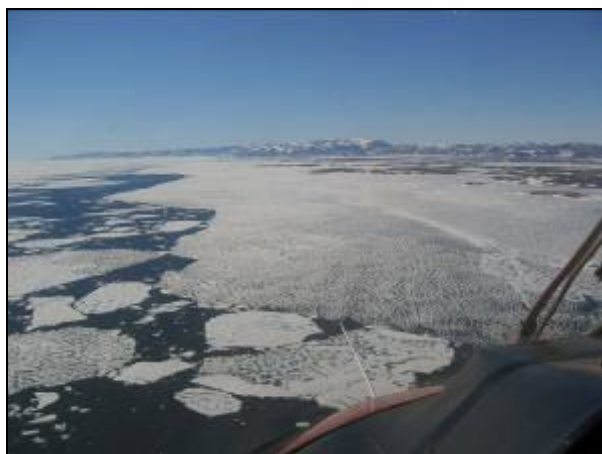
Vores revne set fra lufthøjde ...

Vi var heldige, at en helikopter med en venlig pilot tilfældigvis passerede forbi. Alle tiders mulighed! På baggrund af det observerede: en bred revne fra Fyrretyvekilomternæsset mod syd ca. 35 km langs Germanialand - besluttede vi at få fyret op for alujollen. Den har den fordel, at den kan bruges både som båd og som trækslæde. Det gik rimeligt let og i løbet to