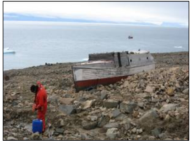
Ole henter vand ved Bådhytten [217].

Dal i godt vejr. Hytten var heldigvis placeret forkert på kortet, hvilket sparede os for krydsning af det store elvleje i Ørsted Dal. På hjemvejen blev vi et par kilometer fulgt på vej af en sur moskustyr. Efter et par signalstifter og en gang kapgang fik vi den rystet af os.