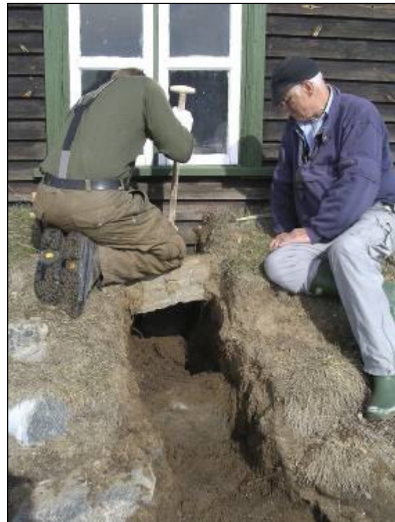
Der graves en dræningskanal ud gennem sydveggen.