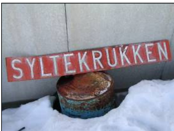
Nedenfor: Ny Syltekrukke [634]