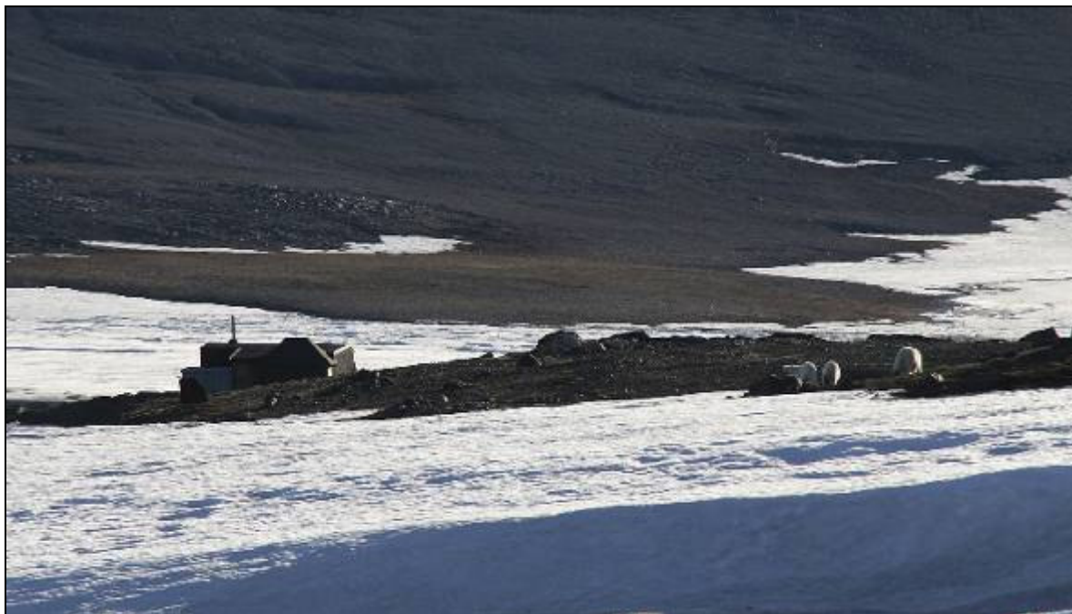
Bjørnebesøg ved Villaen.