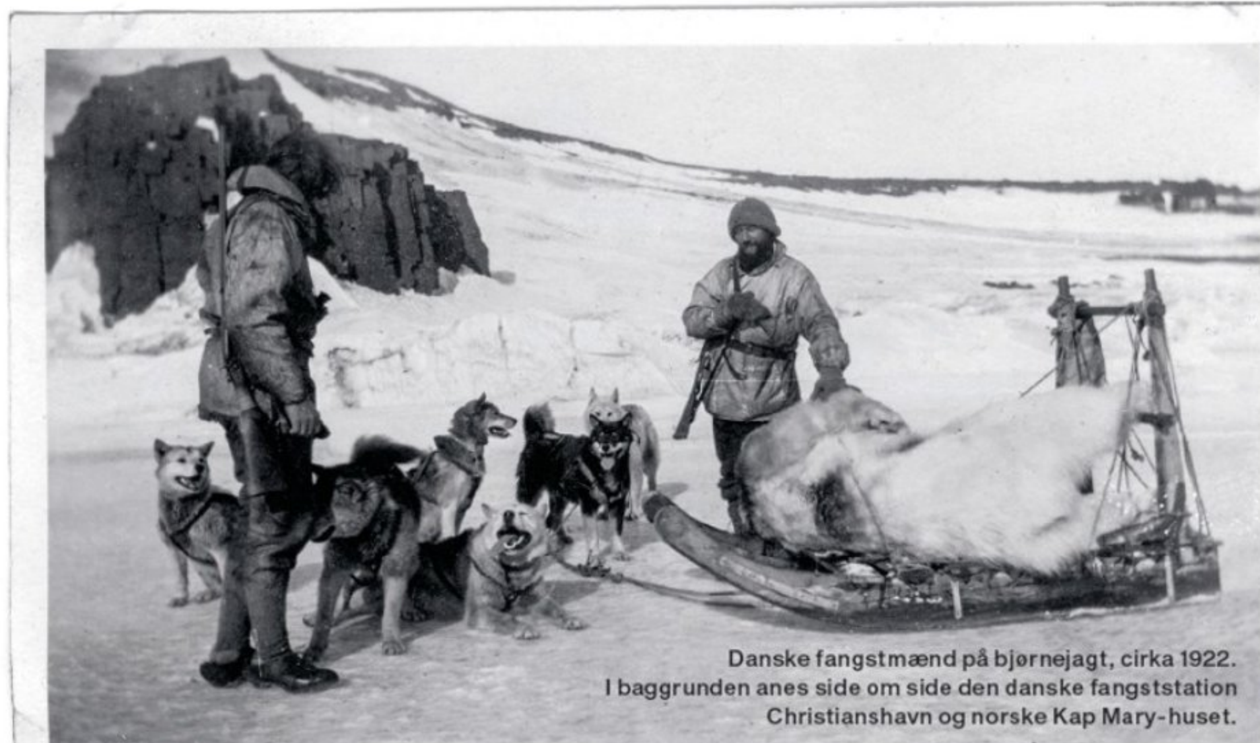
Danske fangstmænd på bjørnejagt, cirka 1922. I baggrunden anes side om side den danske fangststation Christianshavn og norske Kap Mary-huset.

"De var eventyrere, der var indstillet på at tage af sted på usikker grund til et fjernt land. Efterhånden som jeg talte med