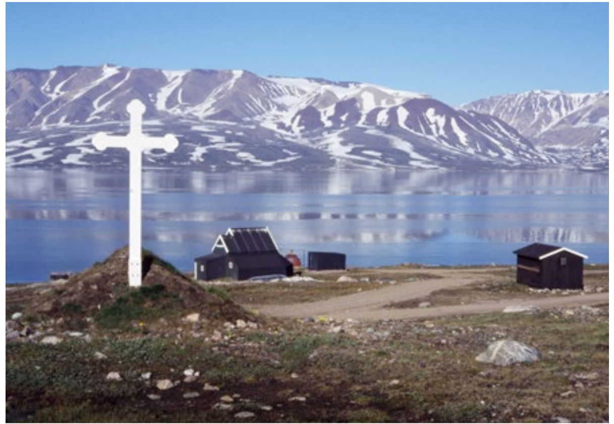
Eli Knudsenip Sandoddenimi, Siriusip ullumikkut qullersaqarfiani, ilerra.

Ritters dilemma er, at han risikerer dødsstraf og repressalier mod